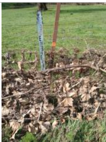
Débris végétaux dans le grillage