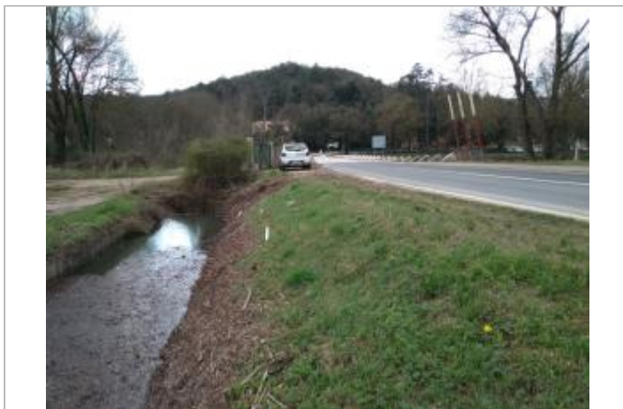
Talus de route