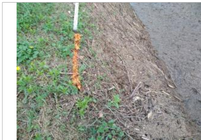
Dépôt contre le talus

Altitude calculée de l'eau (en m) : 170.95 m