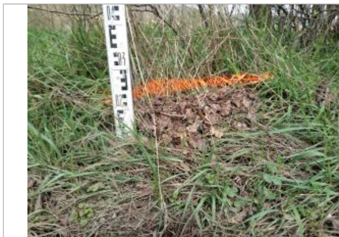
Dépôt dans l'herbe

Altitude calculée de l'eau (en m) : 165.32 m