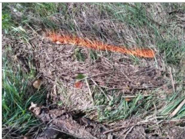
Dépôt contre le talus

Altitude calculée de l'eau (en m) : 165.06 m