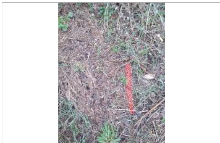
Dépôt en berge

Altitude calculée de l'eau (en m) : 161.06 m