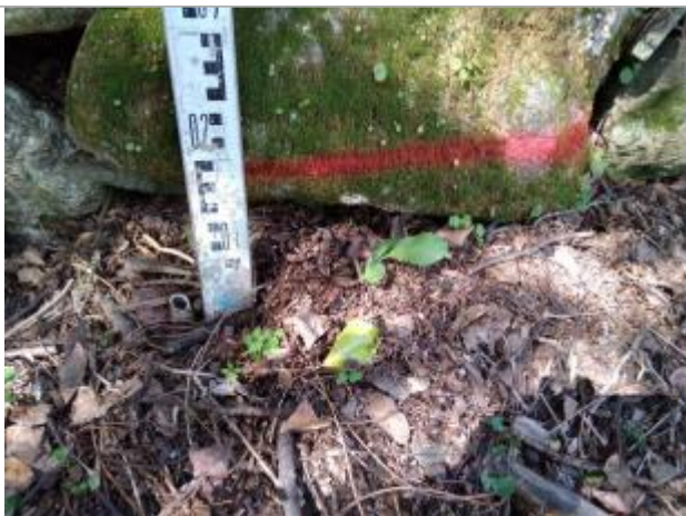
Dépôt contre le mur

Altitude calculée de l'eau (en m) : 133.29 m