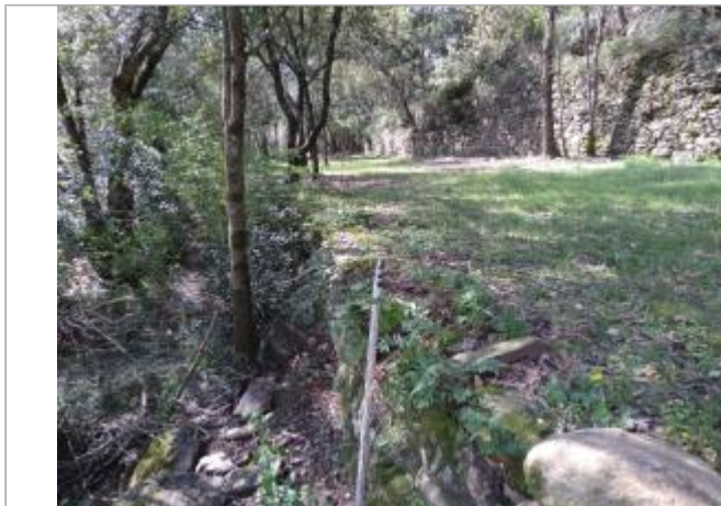
Mur en pierre