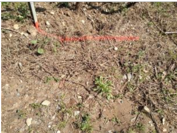
Dépôt en bout de rangée

Altitude calculée de l'eau (en m) : 115.47 m