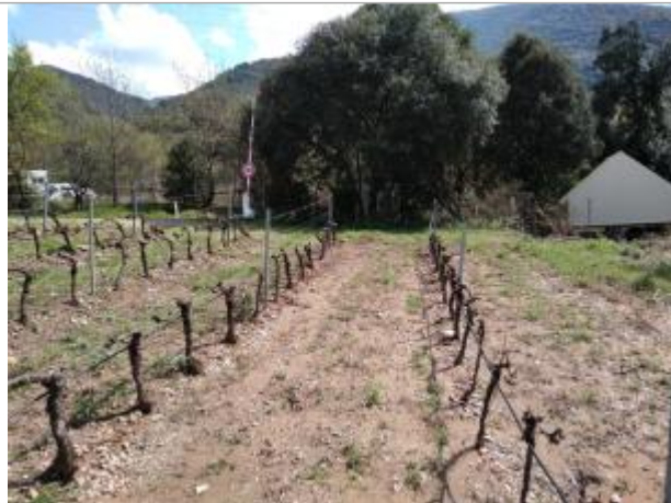
Vigne en amont du pont