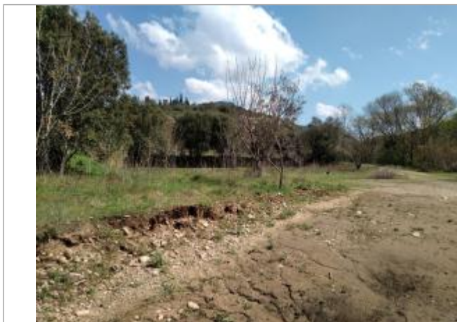
Bord de chemin