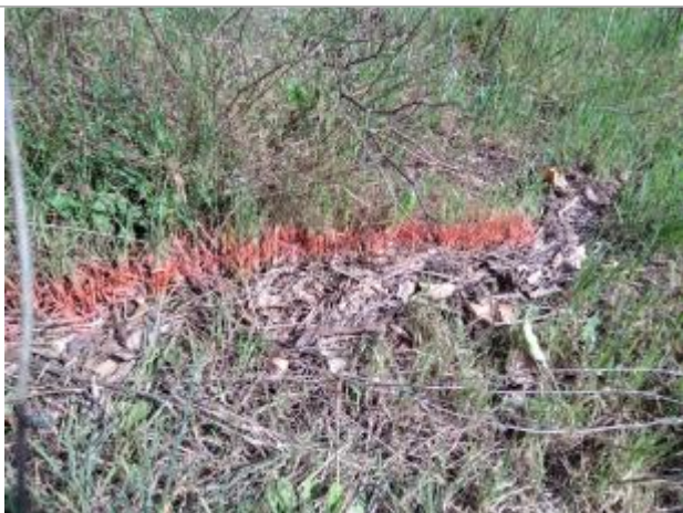
Dépôt au sol

Altitude calculée de l'eau (en m) : 108.32 m