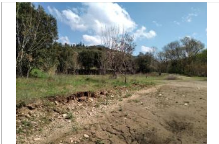
Bord de chemin