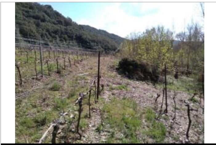
Vigne en amont du parc

GÉNÉRAL Unité de gestion : Méditerranée Ouest Code : 23_ORB22_S_457 Date de mise à jour : 26/04/2023 Auteur : SPC MO