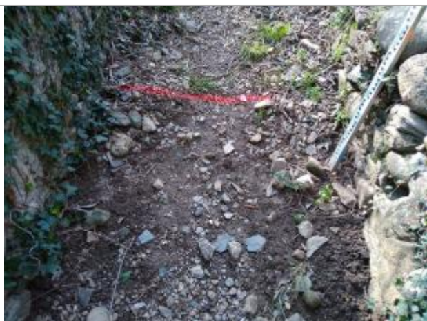
Débris végétaux au sol + limite d'érosion