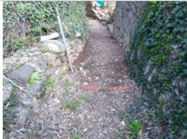
Chemin d'accès aux potagers

Coordonnées WGS84 : X: 2.99049330 / Y: 43.51376150