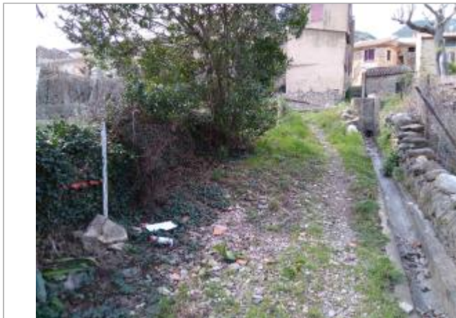
Chemin d'accès aux potagers

Coordonnées WGS84 : X: 2.99038700 / Y: 43.51355460