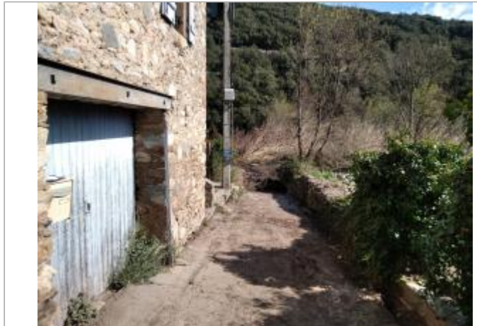
Portail de garage

Coordonnées WGS84 : X: 2.99000640 / Y: 43.51305970