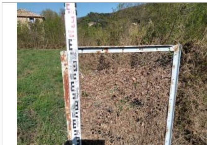
Débris végétaux accrochés au portillon

Altitude calculée de l'eau (en m) : 93.714 m