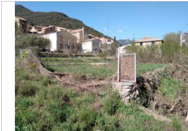
Portillon du potager