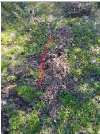
Dépôt au sol