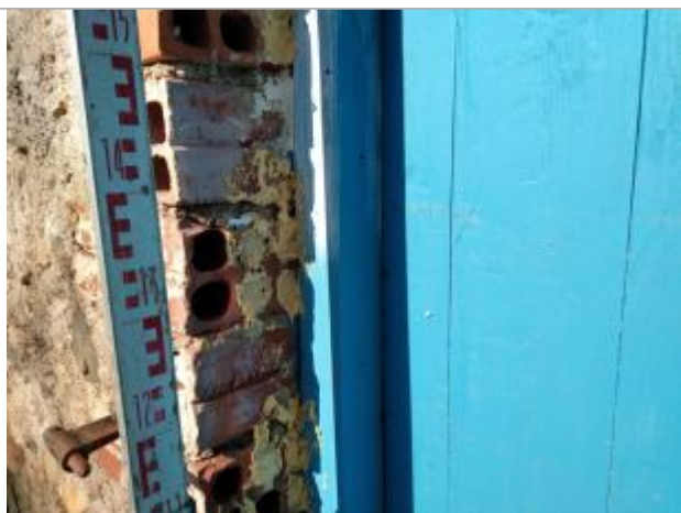
Trace sur la porte

Altitude calculée de l'eau (en m) : 90.353 m