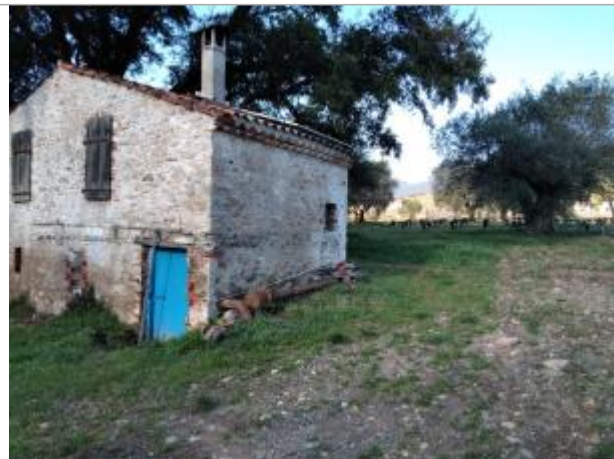
Porte du mazet côté rivière