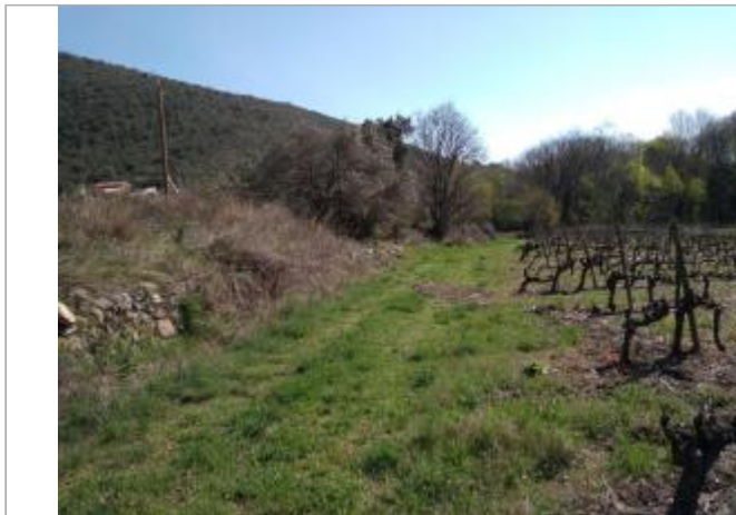
Cep de vigne

Coordonnées WGS84 : X: 3.00627520 / Y: 43.50247050