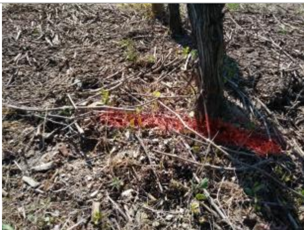
Dépôt au pied de la souche