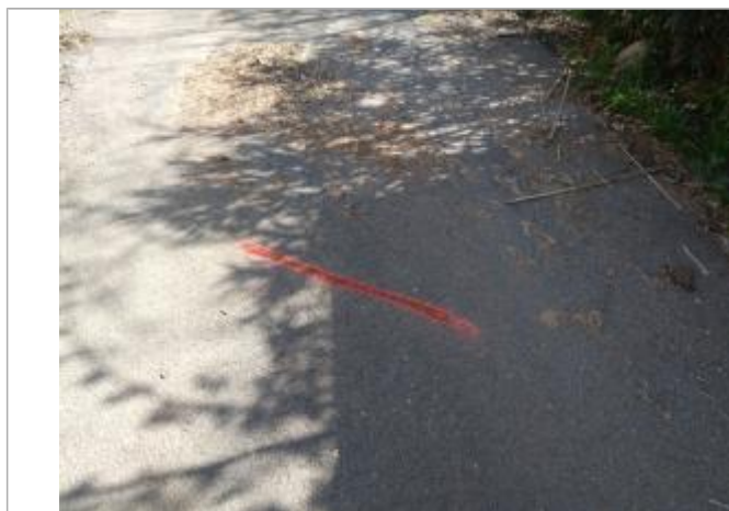
Dépôt sur la chaussée