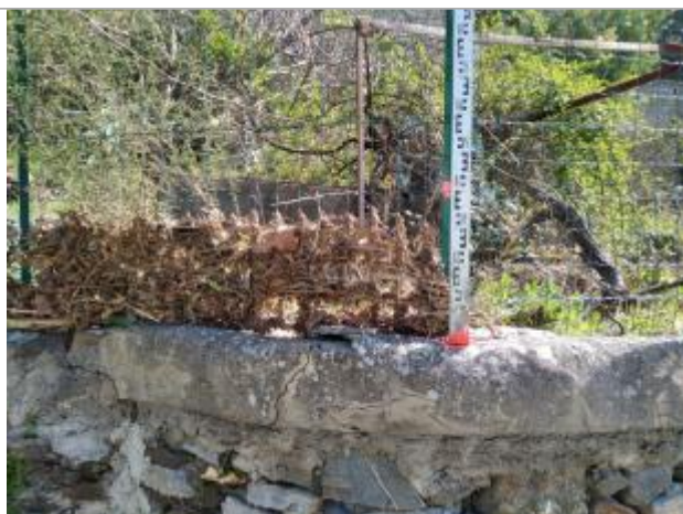
Débris végétaux dans le grillage

Altitude calculée de l'eau (en m) : 79.157 m