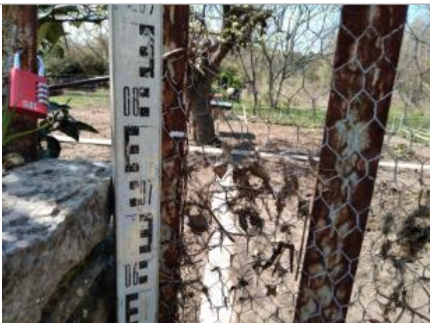
Débris végétaux dans le portillon

Altitude calculée de l'eau (en m) : 78.087 m