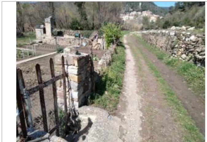
Portillon du potager