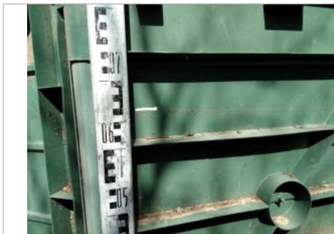
Trace dans le composteur

Altitude calculée de l'eau (en m) : 77.85 m