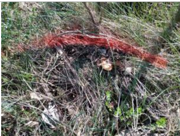
Dépôt sur le muret

Altitude calculée de l'eau (en m) : 75.173 m