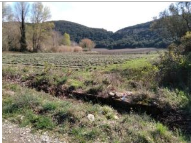
Haut du muret