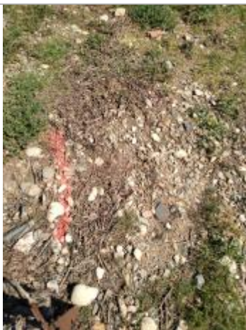
Dépôt au sol