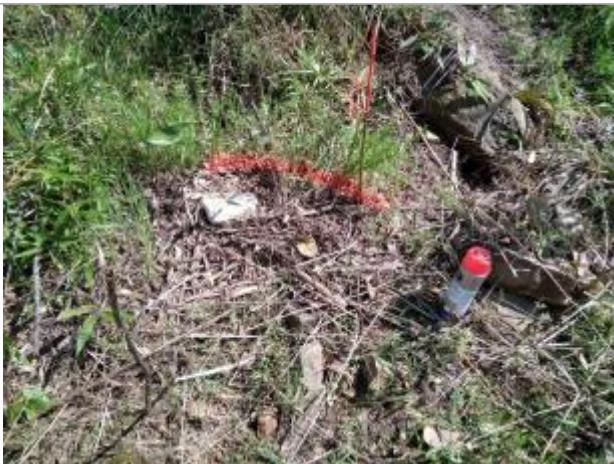
Dépôt au sol

Altitude calculée de l'eau (en m) : 66.57 m