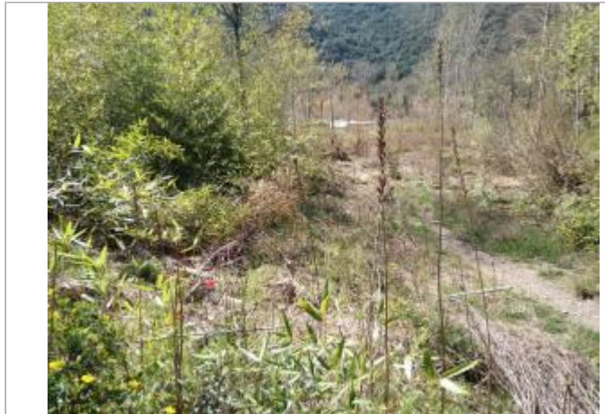
Bordure de chemin

Coordonnées WGS84 : X: 3.04360320 / Y: 43.47934870