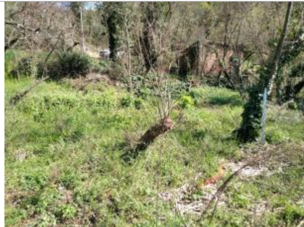
Haut de berge

Coordonnées WGS84 : X: 3.04818160 / Y: 43.47442550