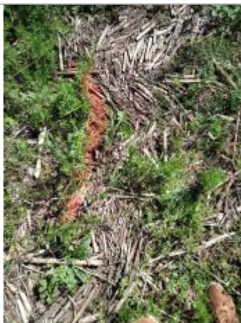
Dépôt en haut de berge