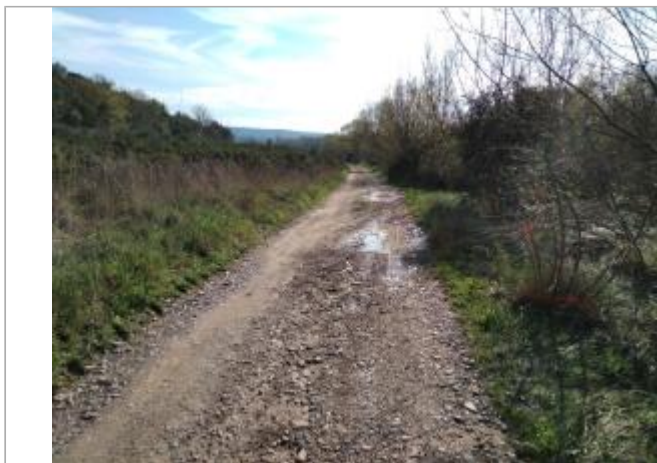
Taillis de frênes en bord de chemin

Coordonnées WGS84 : X: 3.03192740 / Y: 43.46746800