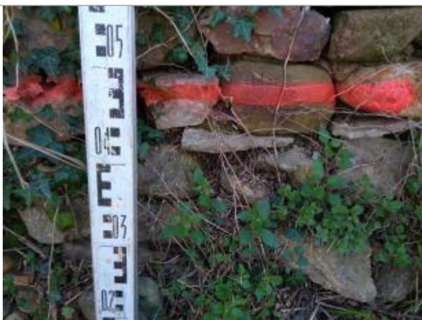
Trace sur le muret

Altitude calculée de l'eau (en m) : 58.86 m