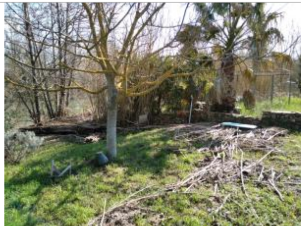
Muret de potager