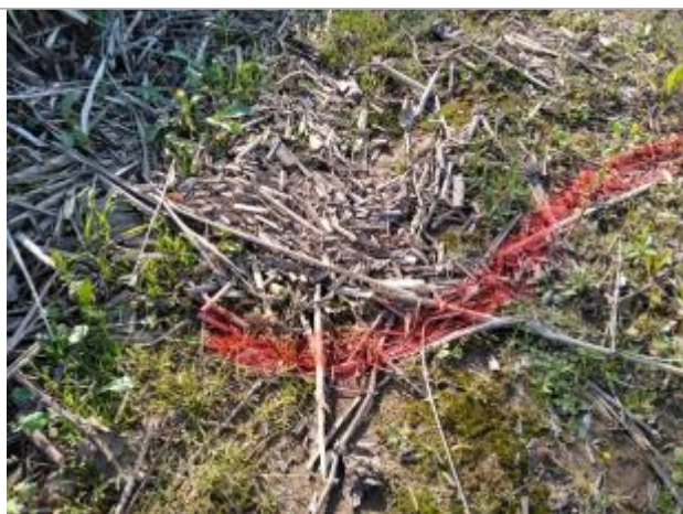
Dépôt au sol