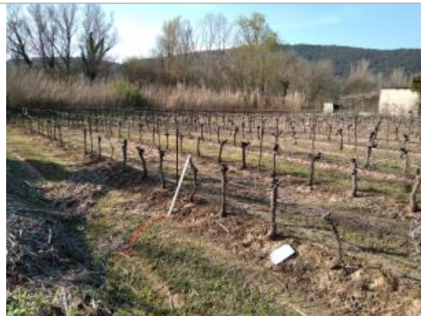
Chemin de vigne

Coordonnées WGS84 : X: 3.02941070 / Y: 43.46421180