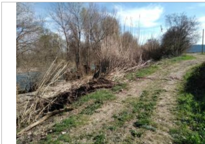
Chemin d'accès à la rivière

Coordonnées WGS84 : X: 3.02762700 / Y: 43.45880530