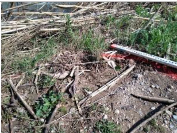
Dépôt sur le chemin