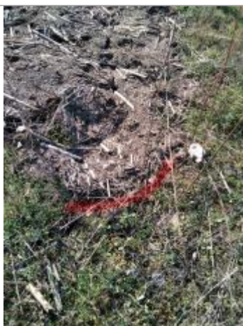
Dépôt au sol