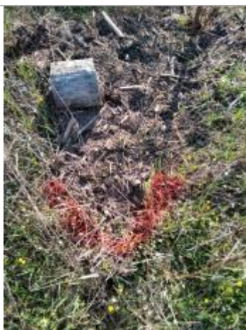
Dépôt au sol