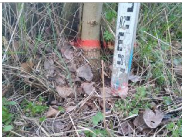
Dépôt au pied de l'arbre