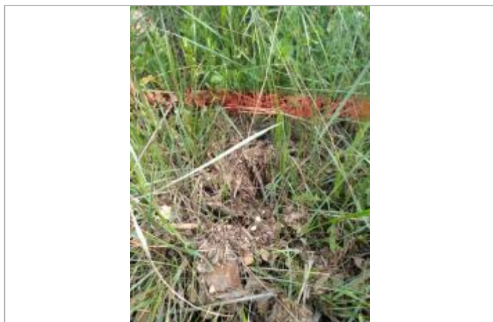
Dépôt contre le talus