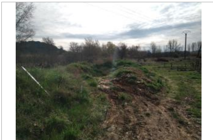
Talus de berge