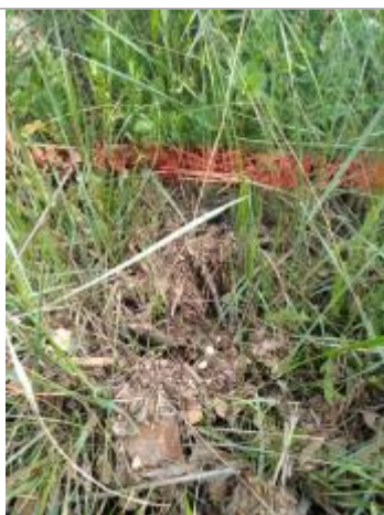
Dépôt contre le talus