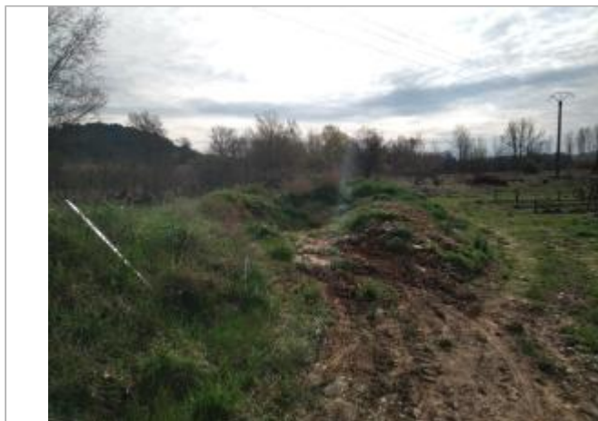
Talus de berge

Coordonnées WGS84 : X: 3.05916400 / Y: 43.45499600