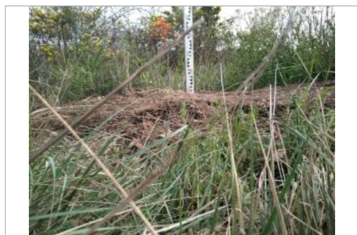
Dépôt dans la végétation