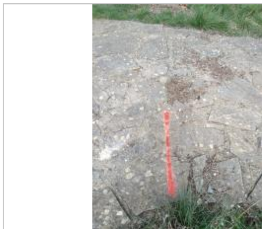
Dépôt sur le sentier