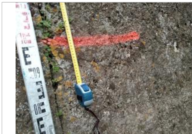
Trace sur la digue