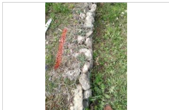
Débris végétaux accrochés aux gabions