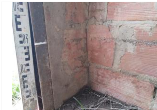
Trace dans le cabanon

Altitude calculée de l'eau (en m) : 22.613 m