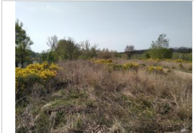
Végétation en bord de chemin

Coordonnées WGS84 : X: 3.12960470 / Y: 43.41007780