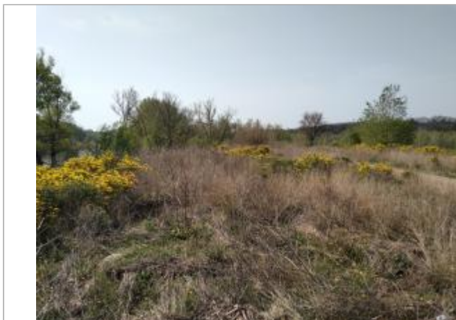
Végétation en bord de chemin