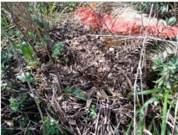
Dépôt dans l'herbe