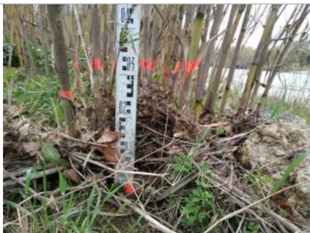
Dépôt contre les cannes de Provence

Altitude calculée de l'eau (en m) : 20.76 m