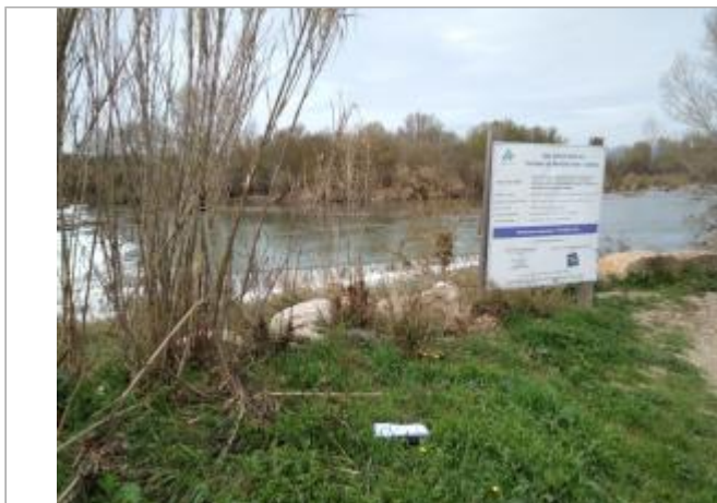
Cannes de provence