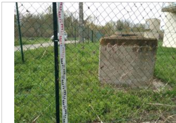
Débris végétaux accrochés au grillage

Altitude calculée de l'eau (en m) : 20.64 m