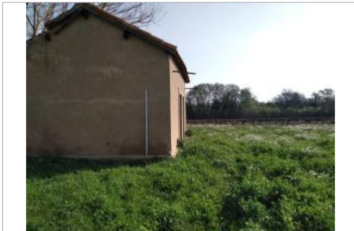
Mur du mazet