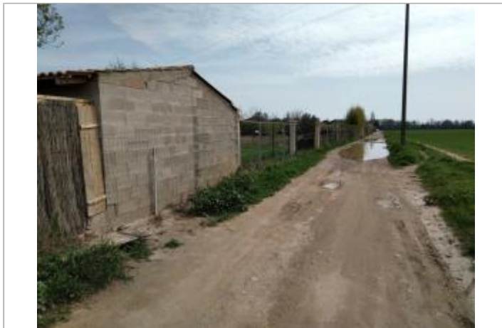
Mur du cabanon