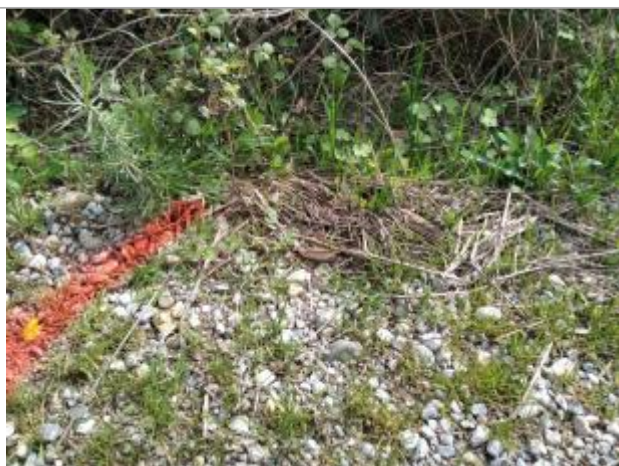
Dépôt au bord du chemin