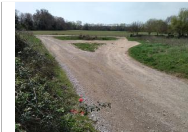
Bordure de chemin

Coordonnées WGS84 : X: 3.17266980 / Y: 43.37443720