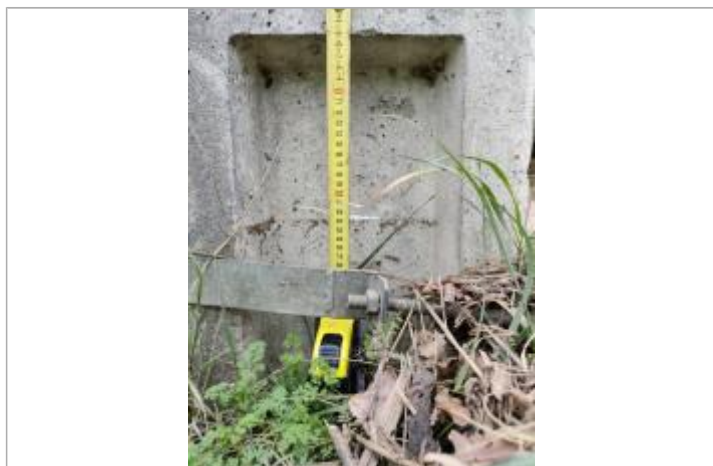
Trace sur le pylône