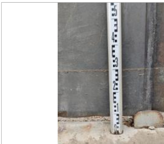
Trace sur le portail