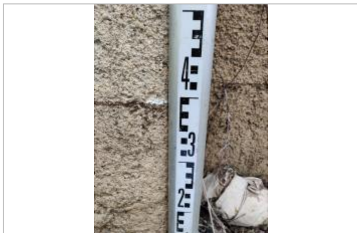
Trace sur le cabanon

Altitude calculée de l'eau (en m) : 13.901 m