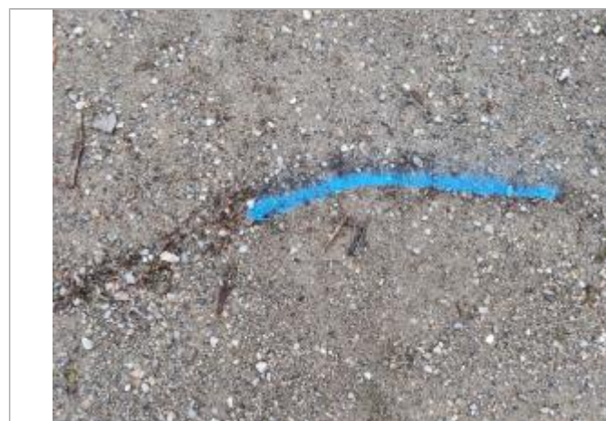
Débris végétaux au sol

Maximum de l'inondation : Oui Visibilité : Non renseigné État du repère : Non renseigné Pérennité : Non renseigné Repère calculé : Non renseigné PHEC : Non renseigné