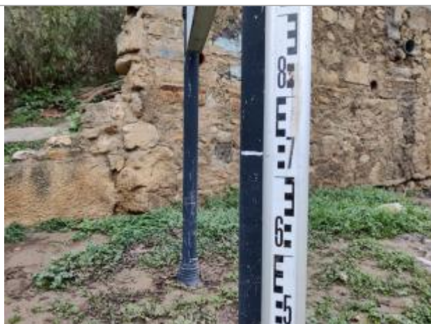
Trace sur le poteau

Altitude calculée de l'eau (en m) : 13.01 m