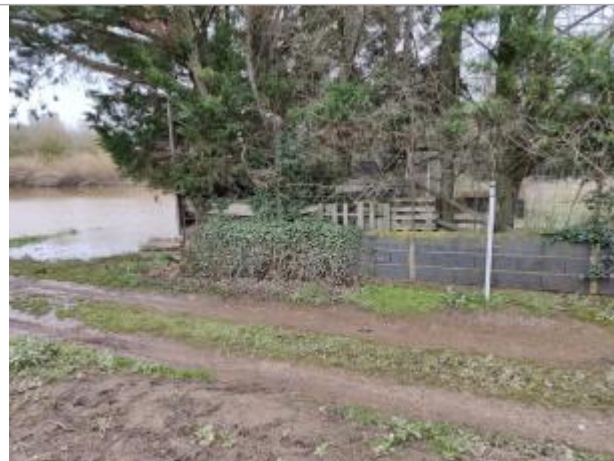
Muret de clôture

Coordonnées WGS84 : X: 3.20059160 / Y: 43.34533170