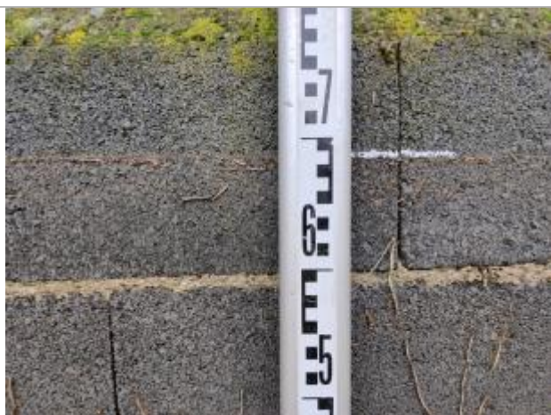
Trace sur le muret