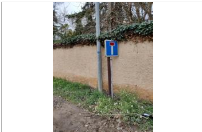
Poteau du panneau impasse