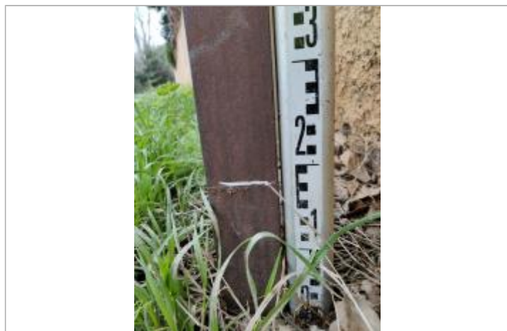
Trace sur le poteau